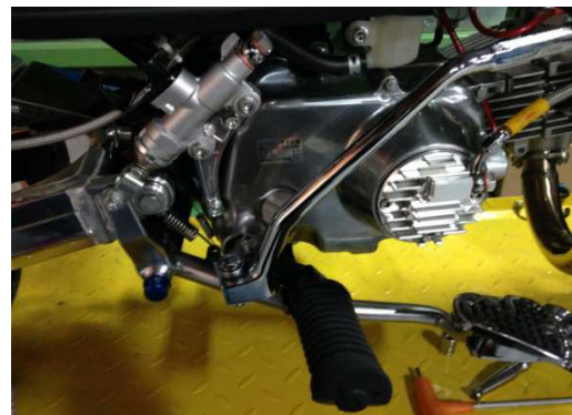
IV-B. 「バックステップブラケット20mm後方移動」の完成ポジション