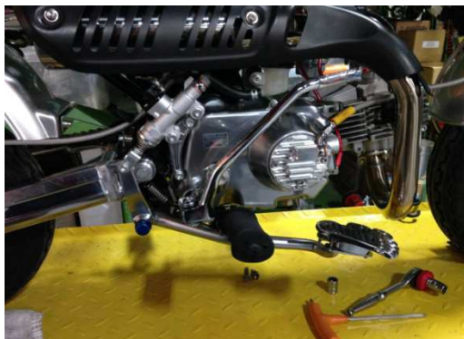
IV-A. ノーマルステップのポジション

III. 画像の右側が前輪側、左側が後輪側です。 画像右側から 1. 純正ボルト(M8×20) 2. 付属ボルト(M8×15とスプリングワッシャー) 3. 付属ボルト(M8×15とスプリングワッシャー) 1～3の順に取り付けします。ネジロック材の使用を推奨します。 注意)1. 純正ボルト(M8×20)はIIにて取り付け済みです。 リアブレーキランプの点灯を確認します。 バックステップブラケット20mm後方移動を取り付けすることで、ブレーキ位置が地面側へ下がります。ブレーキスイッチのセット用ナットを時計回りに回していただき、適正な位置へセットし直してください。